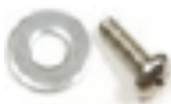
Vis / rondelle du support du caisson de sécurité (B)