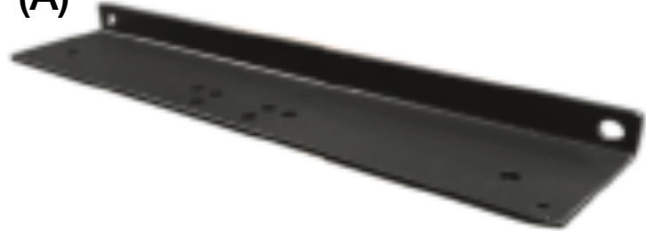
Support de sécurité du caisson (A)